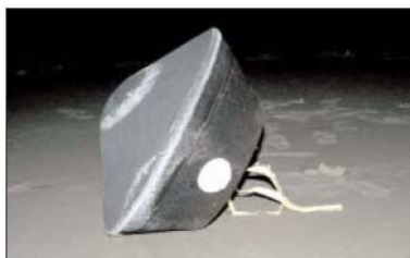
The Stardust sample return canister as seen from NASA's DC-8

2004, as well as samples of interstellar dust, which scientists believe can help answer questions about the origin of the solar system (DAILY, Dec. 22, 2005).